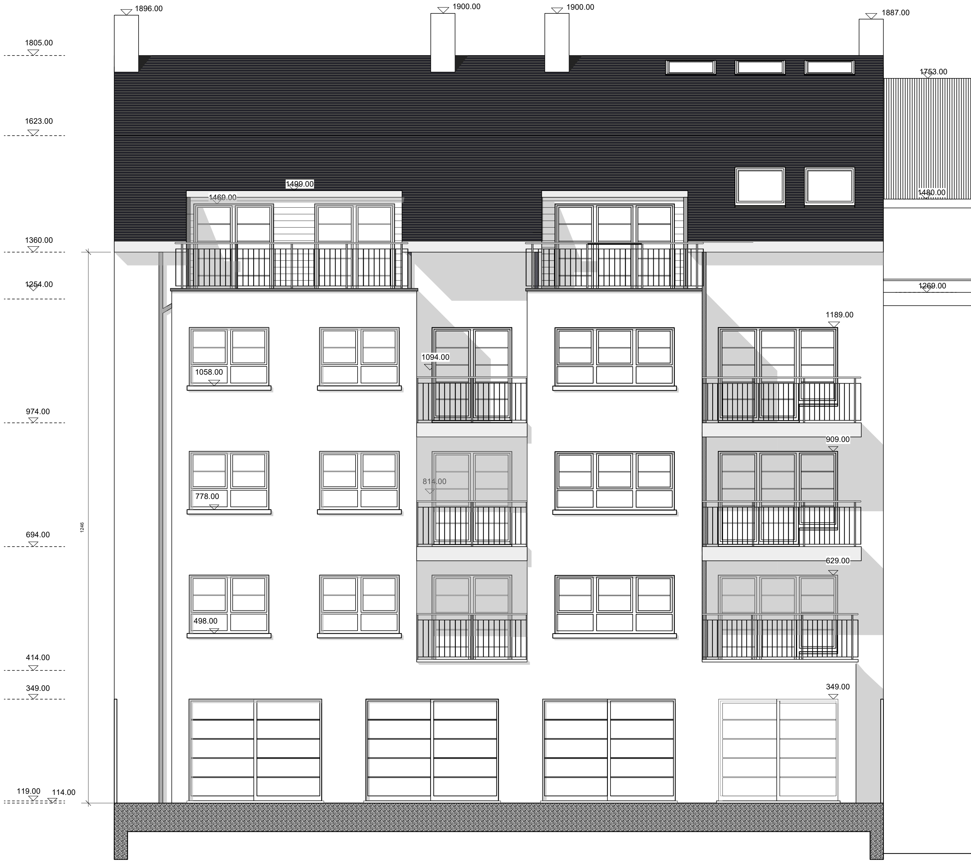
SITUATION PU 2003 FACADE JARDIN