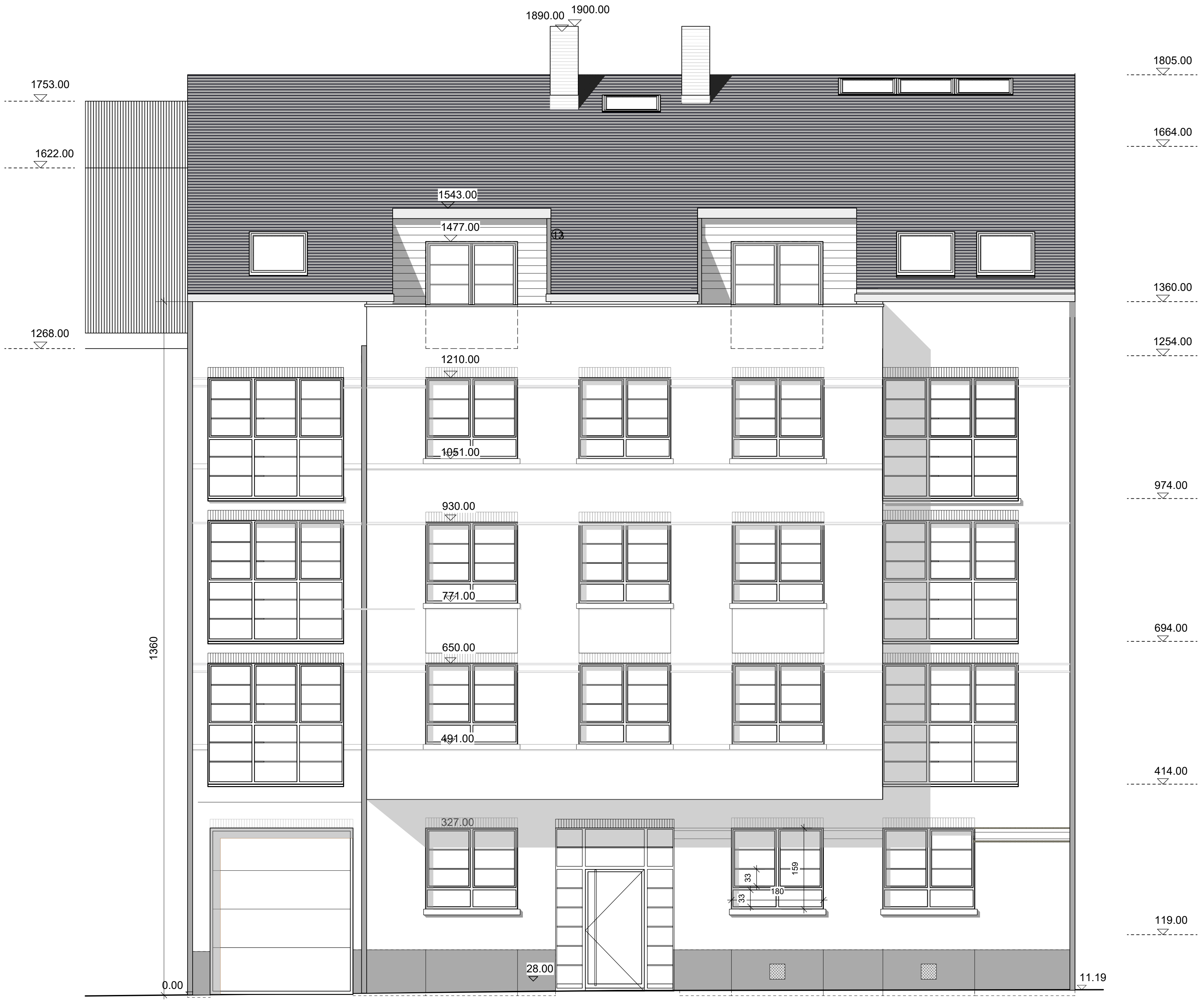
SITUATION PU 2003 FACADE RUE